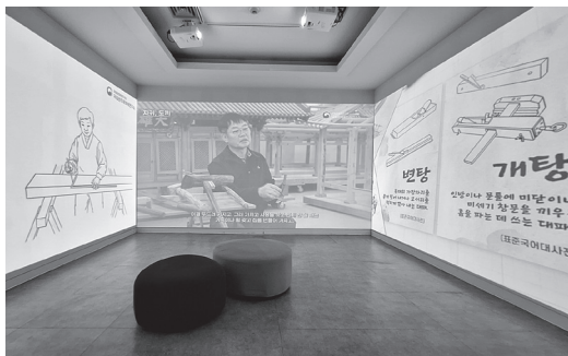
图 4：匠人工作影像展示

术史研究》为基础，通过对木结构建筑的构成元素、植被与建筑构法、木构建筑用材、制作木结构建筑的技术和工具、木结构建筑的制造工序、石器和金属器加工、制作木结构建筑的专业工人和生产组织等方面对建筑工程师、船工、工具的技术师、工具的使用行为等进行匠人匠作工艺的展开介绍（图 6）。韩国则以历史史料较为充分的朝鲜时期王陵匠作和彩画等特殊工艺的技术内容进行深入展开，工具研究以木材与工具为主题，对朝鲜时代锯对木材利用的影响、瓦当制作工具等内容进行了深入展开。中国代表南京工业大学建筑学院院长郭华瑜老师介绍了南京工业大学与中国勘察设计协会传统建筑分会共同设立的“中国传统建筑工匠技艺研究中心”（简称“工匠中心”）的工作情况（图 7），从建筑文化与匠人的管理制度层面，梳理传统建筑技术传播的途径，传统建筑工艺遗产保护中的励匠机制，传统建筑工匠的文化特点。并对中国工匠技艺本体历史演进的研究成果整理，从技艺的历史演进、工匠人物传记、技术特点、地域性技术与特色工艺等方面对传统建筑营造技艺本体进行剖析（表 2）。