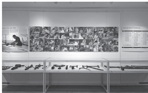
图 5：传统建筑工具展示