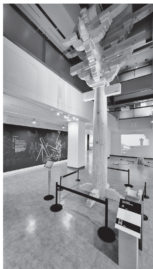
图2：“韩国传统建筑：匠人的力量，工具的力量”展馆现场