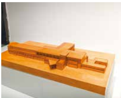
图 8: 南京空军新生社。设计/建成: 1947年/1947年(已拆); 建造地点: 南京市玄武区小营; 甘昊分析

和平宾馆作为杨廷宝在新中国成立后所设计的重要作品, 已经在许多研究中进行过解析, 大多数的关注点在于它极具现代感的外观, 以及得体合宜的内部空间组合。但是同样值得关注的, 是这一形体现