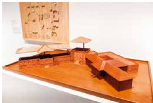
图3 北京清华大学图书馆扩建工程。设计/建成：1928年/1931年；建造地点：清华大学校园；张旭分析