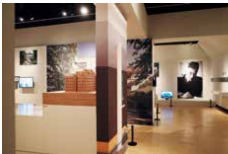
图 1:《杨廷宝：一位建筑师和他的世纪》展览现场 a

1927 年，杨廷宝先生经欧洲回国，旋即受邀加入基泰工程司，开始辉煌的职业生涯。杨廷宝的建筑创作生涯大致经历了三个主要阶段，分别是在 20 世纪的抗日战争之前 10 年、抗日战争之后 10 年，以及新中国成立初期 10 年。作品的地域跨度从北到南，涉及天津、北京、南京、上