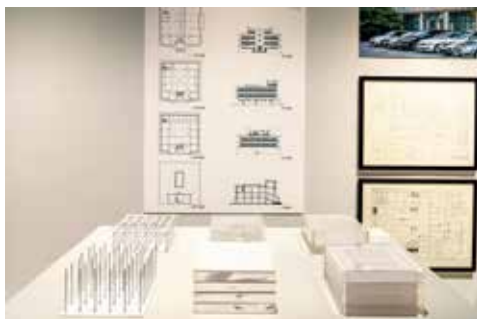
图 9: 南京招商局办公楼。设计/建成: 1947年/1947年; 建造地点: 南京市下关区江边路24号; 朱昊昊分析