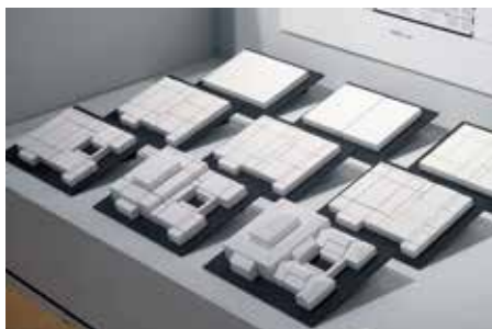
图11：南京工学院沙塘园食堂。设计/建成：1957年/1958年；建造地点：东南大学四牌楼校区沙塘园学生生活区；朱昊昊分析

这些扩展性的视角反过来有助于解读杨廷宝先生在单体建筑中的考虑。例如北京和平宾馆，该建筑的设计与建造被广泛认为是杨廷宝在现代建筑设计中的极大成就。但如果将建筑设计视为一种“抓总”性的综合，那么建筑设计所体现的不仅仅是轴线比例的问题，而且也是关于场地、环境、流线、功能，以及整体空间的完整统一的问题，使之成为一个“将建筑环