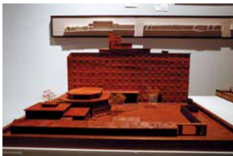
图 10: 北京和平宾馆。设计/建成: 1951年/1952年; 建造地点: 北京市东城区金鱼胡同3号; 张旭分析