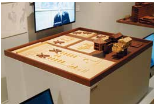
图 6: 南京公教新村。设计/建成: 1946年/1946年; 建造地点: 南京市玄武区北京东路51号等5处; 蒋梦麟分析