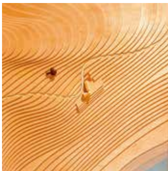
图 5: 重庆嘉陵新村圆庐。设计/建成: 1939年/1939年; 建造地点: 重庆市渝中区嘉陵新村; 张映乐分析