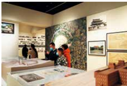
图 2:《杨廷宝：一位建筑师和他的世纪》展览现场 b