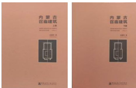
图1:《内蒙古召庙建筑》封面

出版信息：张鹏举著，由中国建筑工业出版社于2020年12月出版，字数1151千字；ISBN：978-7-112-20818-0